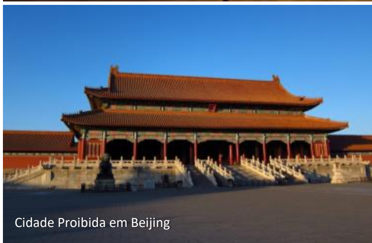
Cidade Proibida em Beijing