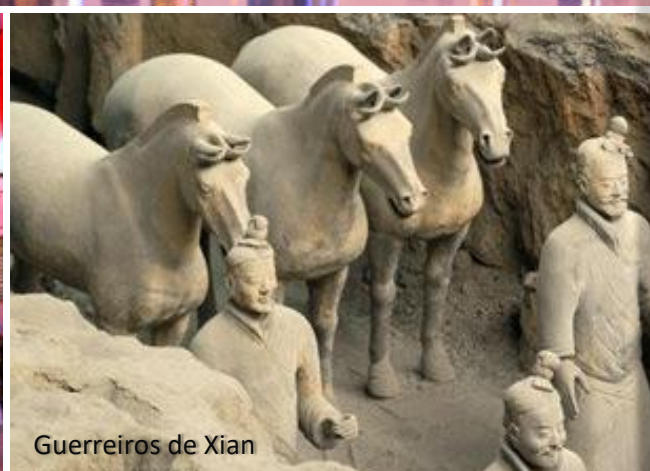
Guerreiros de Xian