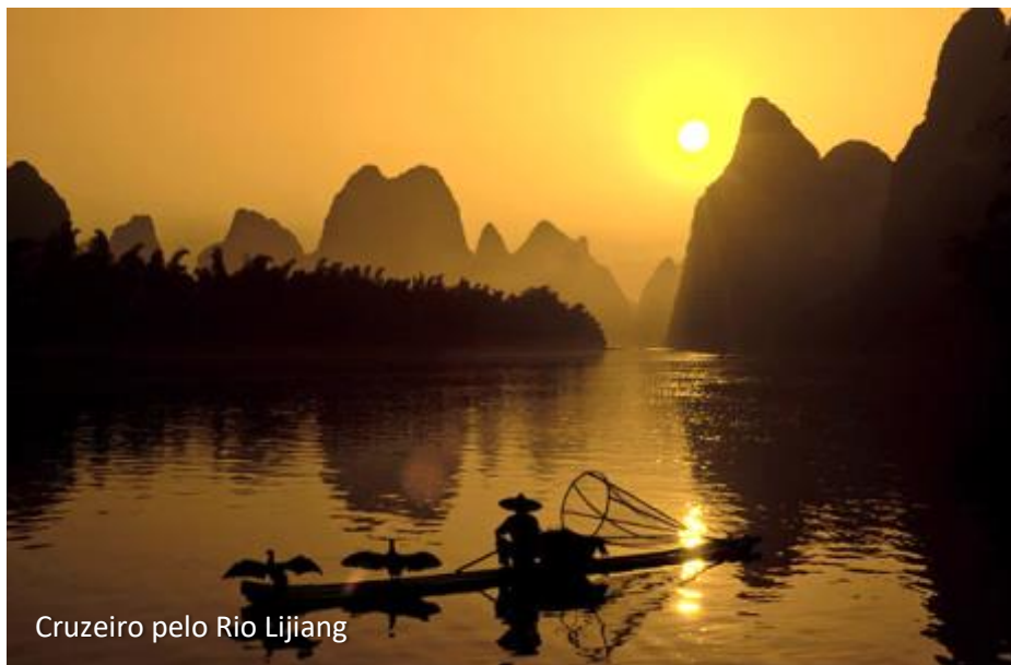
Cruzeiro pelo Rio Lijiang